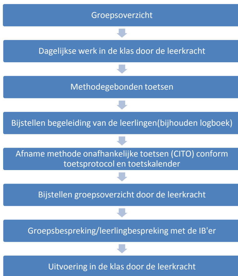
Figuur 2. Overzicht ondersteuningsstructuur

Indien extra interventies onvoldoende resultaat opleveren, dan kan overwogen worden om de leerling te laten doubleren of te versnellen. In sommige gevallen komen wij tot de conclusie dat we een leerling niet langer kunnen begeleiden. Op dat moment zullen wij een andere, beter passende plaats zoeken. Dat kan ook het speciaal (basis)onderwijs zijn. Ouders worden hier tijdig over geïnformeerd en bij betrokken.